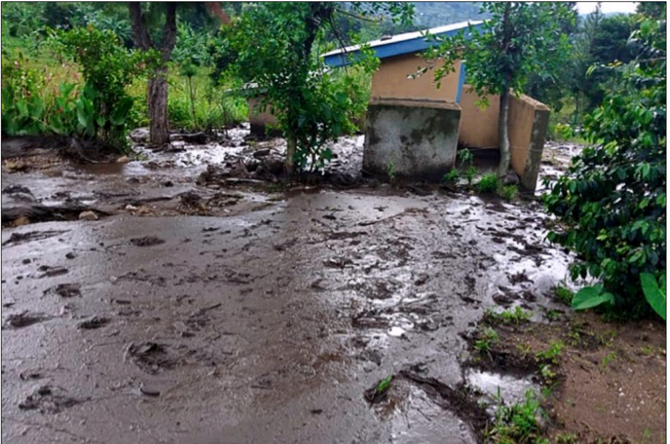
Dasselbe Gelände, auf dem sich die Schule früher befand