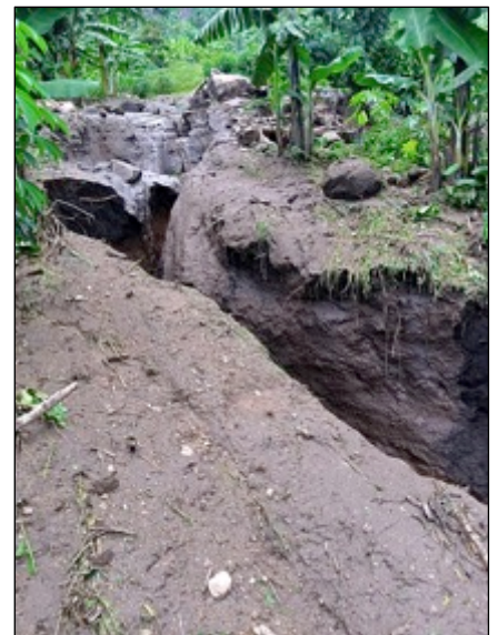
Eine tiefe Schlucht öffnete sich