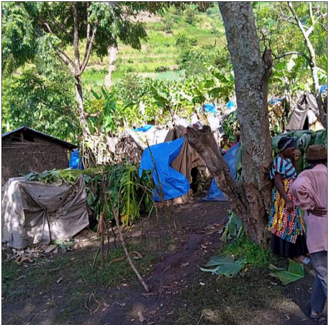
Vertriebene Flutopfer bauten provisorische Häuser mit Bananenblättern und Planen