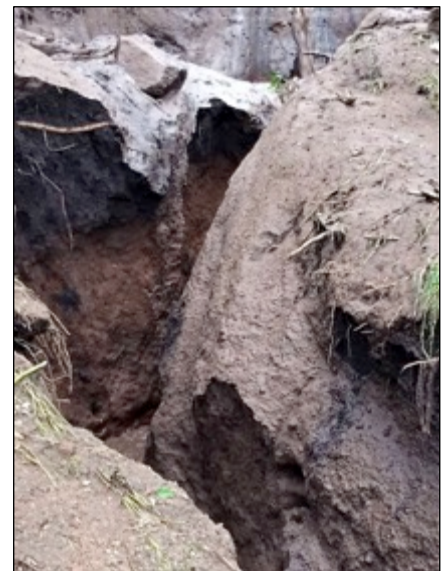
Überschwemmungen und Erdrutsche zerstörten die Ernten. Die Wasserströme bildeten tiefe Kanäle