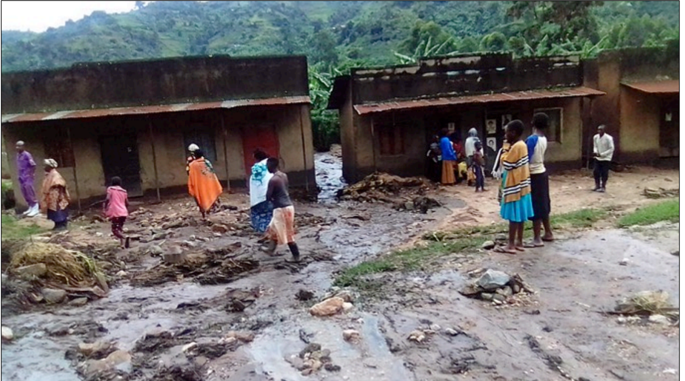
Menschen, die zusehen müssen, wie ihre Häuser von Wasser und Schlamm überflutet werden