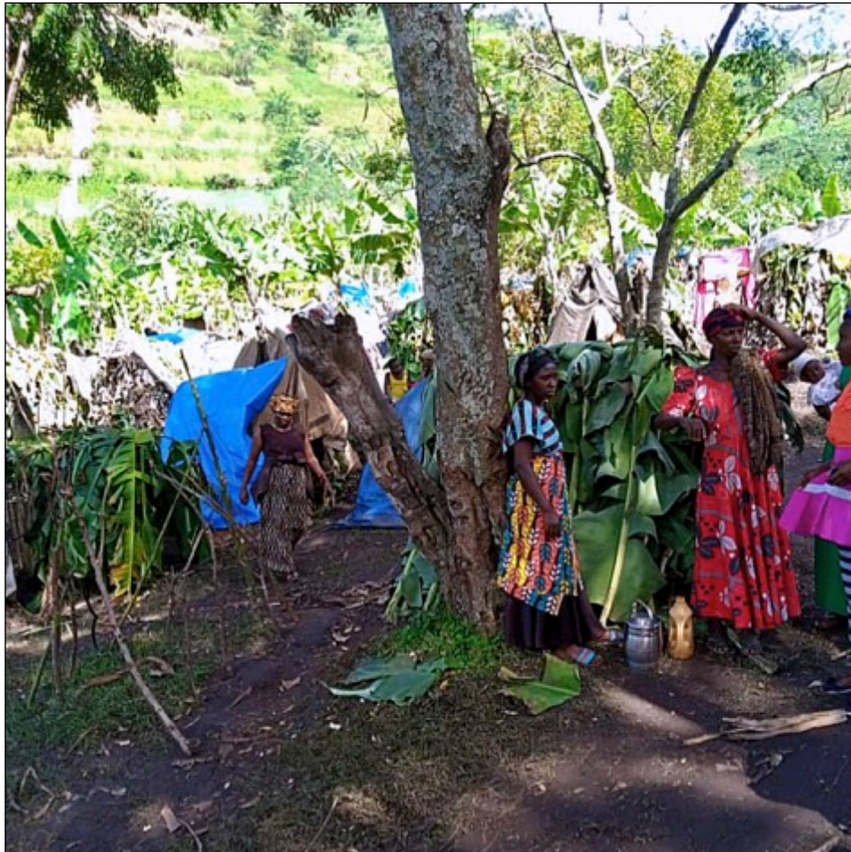
Vertriebene schufen mit Bananenblättern provisorische Unterkünfte