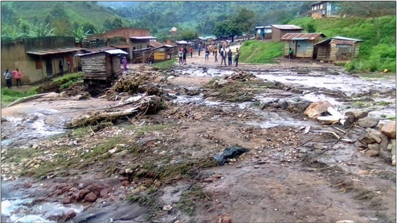
Ein kleines Handelszentrum, wohin die Menschen gehen, um Lebensmittel und Artikel des täglichen Bedarfs zu kaufen, wurde weggefegt und 34 Häuser wurden zerstört