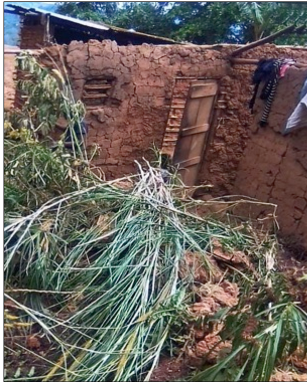
Niemand kann in Häusern leben, die völlig zerstört wurden