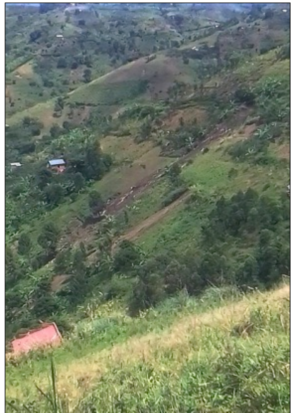
Ein Dorf, das getroffen wurde. Wasser strömte von der Bergkuppe bis zum Fuß des Berges