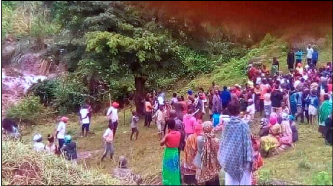
Gestrandete Opfer, die ihr Zuhause verloren haben. Die Regierung gibt ihnen ein Gebiet in Buschland, wo sie nach der Bereitstellung von Holzzelten angesiedelt werden sollen.