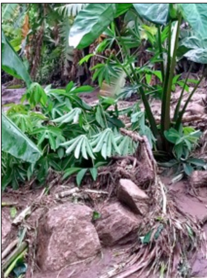
Eine Maniokplantage wurde zerstört