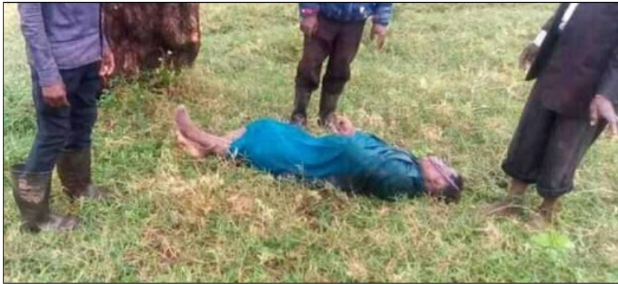
Diese Frau war zusammengebrochen. Ihr wurde geholfen, nachdem ihr Sohn von den Überschwemmungen erfasst wurde und starb