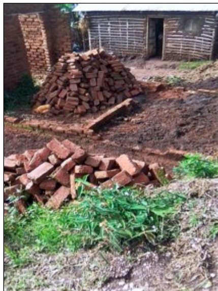
Ein unfertiges Haus wurde zerstört