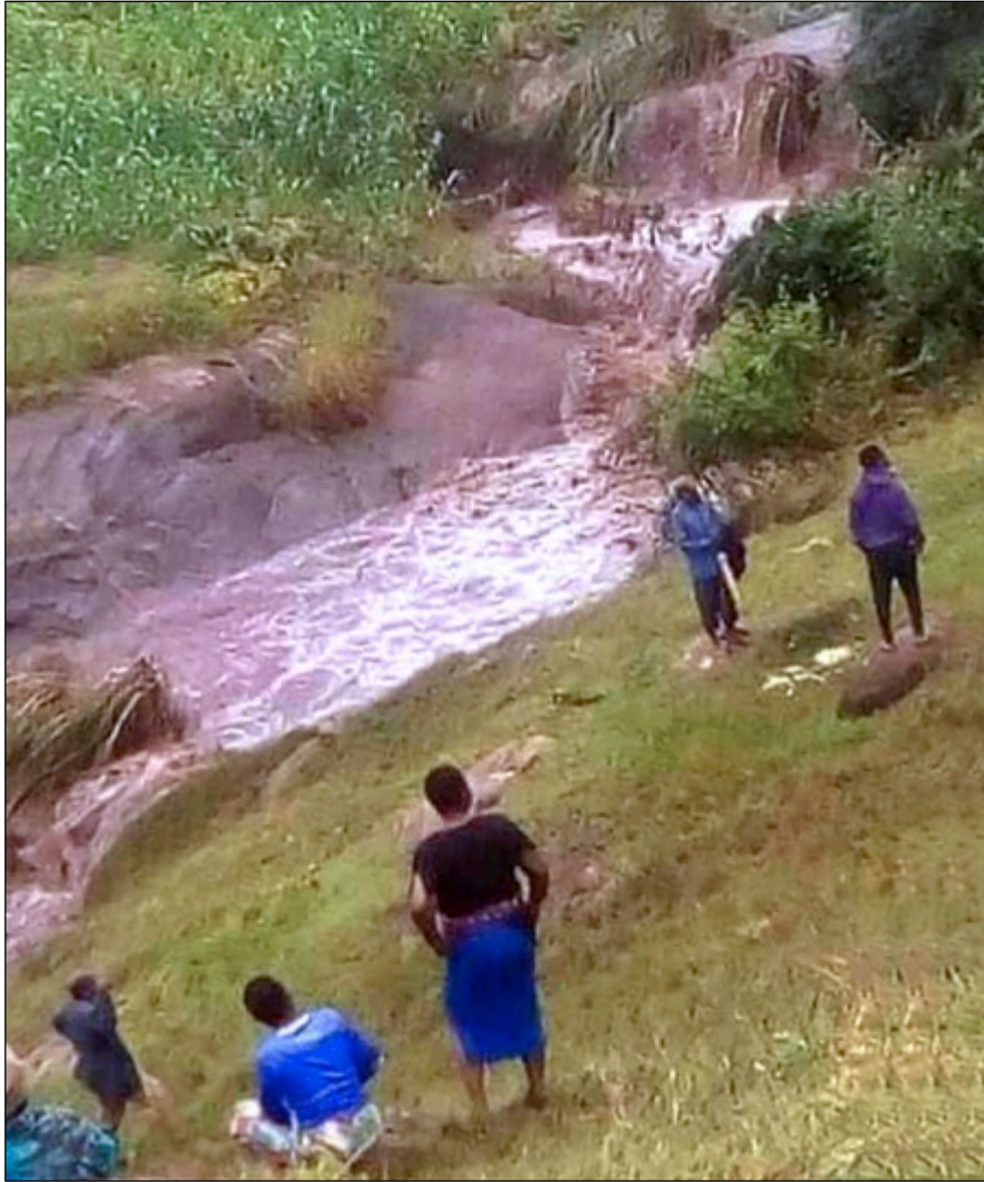
Tosende Wassermassen haben die Straße unpassierbar gemacht