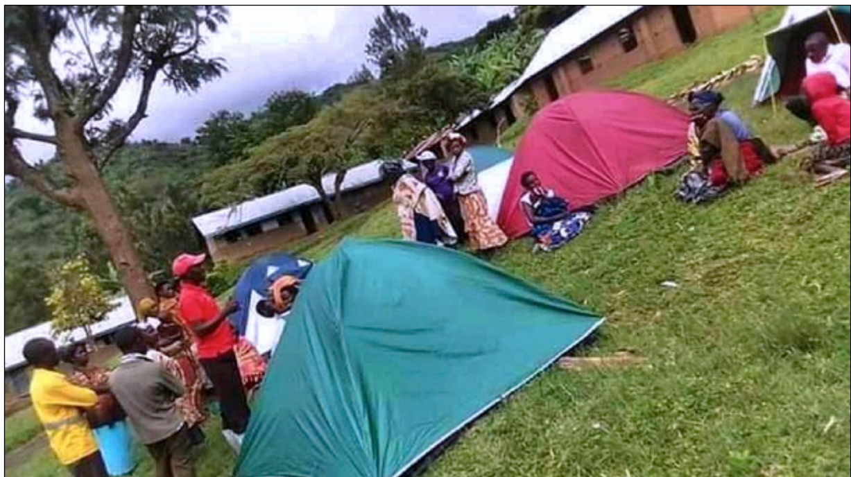
In einer Kirche wurde ein Notlager für Vertriebene eingerichtet