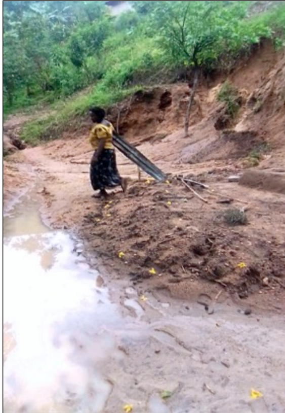
Eine Frau sammelt einige der Materialien, die von ihrem Haus weggefegt wurden