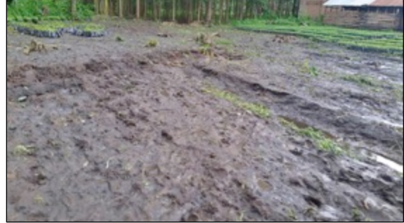
Kaffeeaufzuchtbeete, von Sturzfluten weggeschwemmt