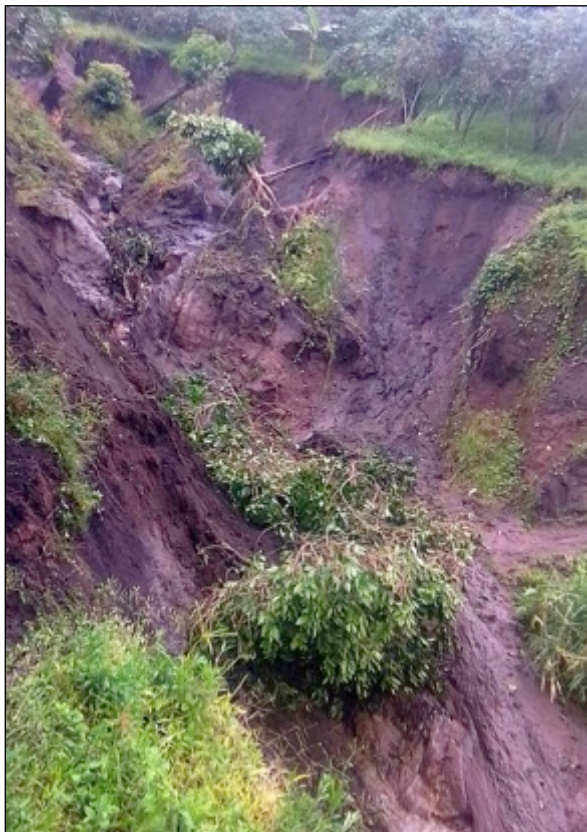
Schlamm und Erdrutsche