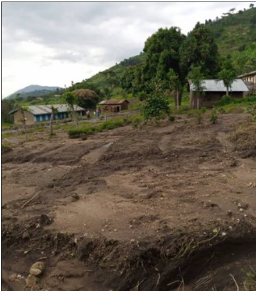
Eine weitere zerstörte Schule

Dies sind die Fotos, die ich in den Teilen von Maliba gemacht habe, die ich noch erreichen konnte. Einige andere Orte, die schwer getroffen wurden, und die Lager, in denen sich Menschen niedergelassen haben, sind zu weit entfernt, um sie zu Fuß zu erreichen, und sie sind jetzt auch für Motorradtaxis unzugänglich.