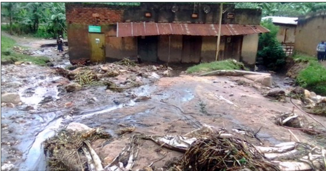
Dieses Haus wurde von den Überschwemmungen heimgesucht, bei denen ein achtjähriger Junge starb