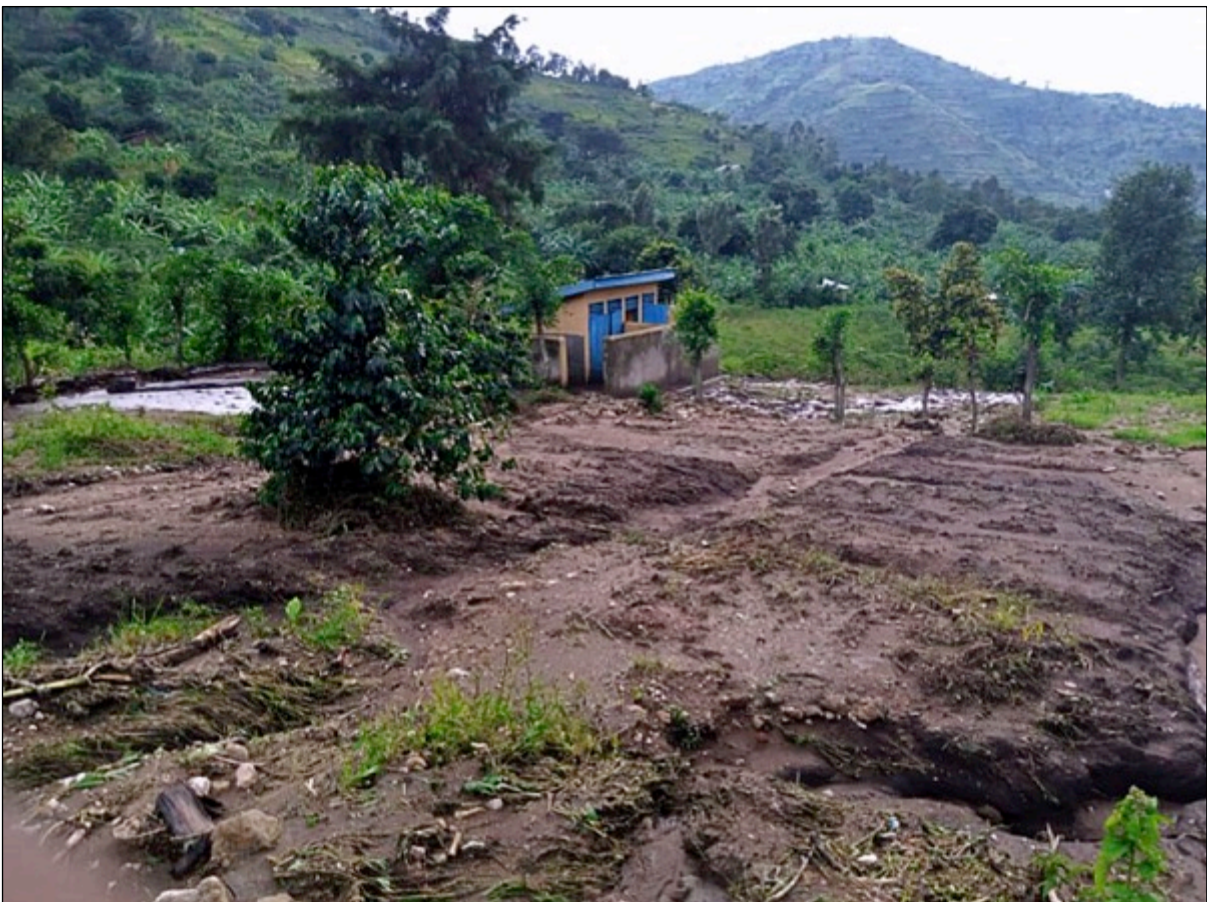
Isule-Grundschule: Die Klassenzimmer wurden alle mitgerissen, nur die Toilette blieb übrig