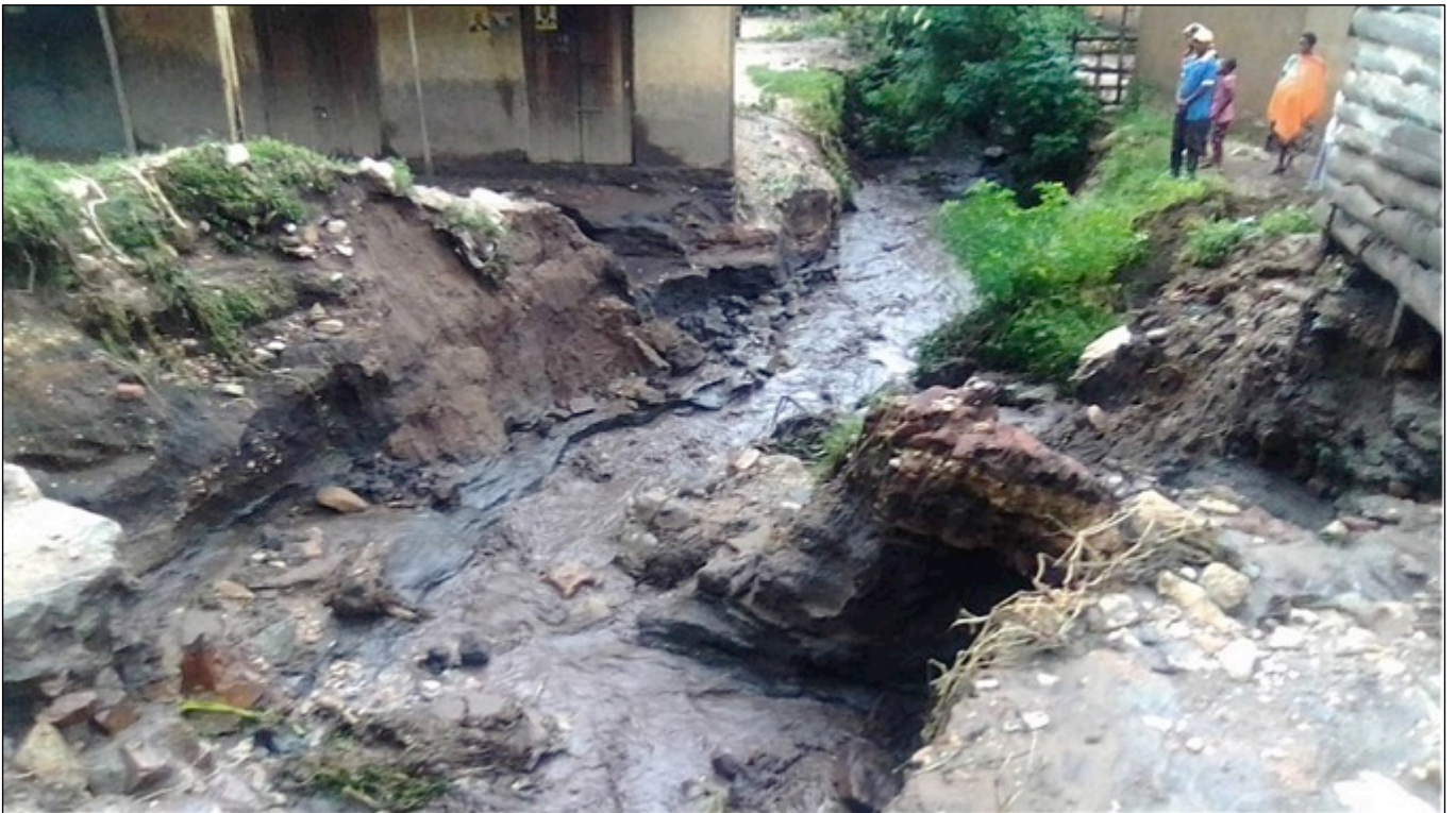
Das Wasser ergoss sich zwischen die Häuser und bildete einen tiefen Kanal